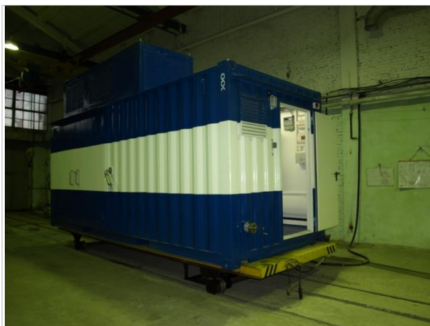
Модульные компрессорные станции

Производятся модульные компрессорные станции: