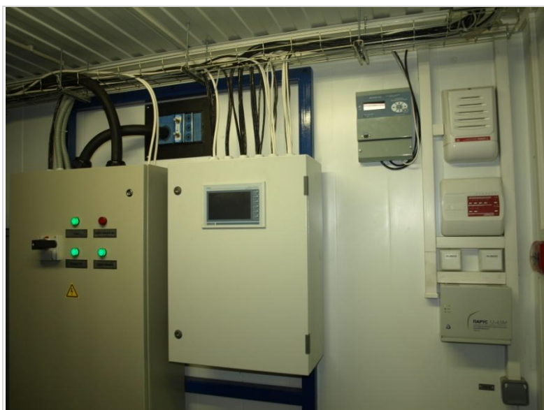
Модульная азотная станция

Система автоматики обеспечивает надежную работу модульной компрессорной станции без постоянного присутствия обслуживающего персонала и может обеспечивать хранение информации и ее выдачу в корпоративную информационную сеть предприятия. Автоматика может строиться с учетом уже имеющегося оборудования и обеспечивать его интеграции в общую систему.